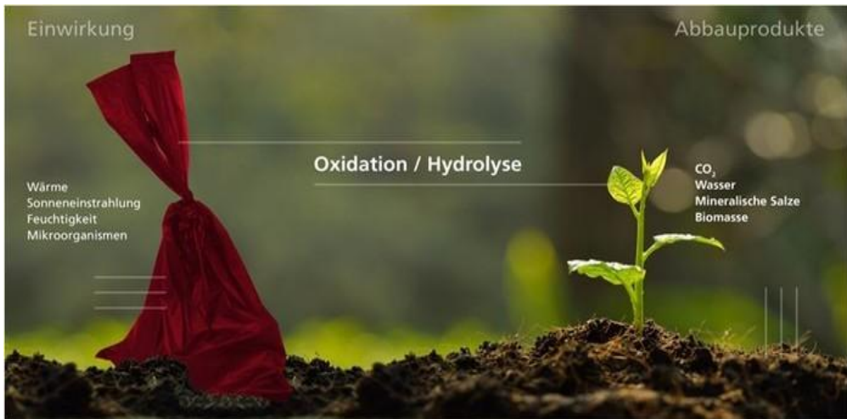
Abbildung 4: Schematische Darstellung des Abbauprozesses

Entscheidend ist, dass der biologische Abbau auch unter hiesigen Wetterbedingungen funktioniert. Einige biologisch abbaubare Materialien benötigen für den Abbau Temperaturen von bis zu 70 °C, sodass der Prozess in der Natur ebenso wenig funktioniert wie bei PE. Die Abbaubarkeit unter niedrigen Temperaturbedingungen, eine Grundvoraussetzung für das Funktionieren in der Natur, wird von einigen Zertifizierungsunternehmen getestet, wie etwa für das "OK compost HOME" Siegel.