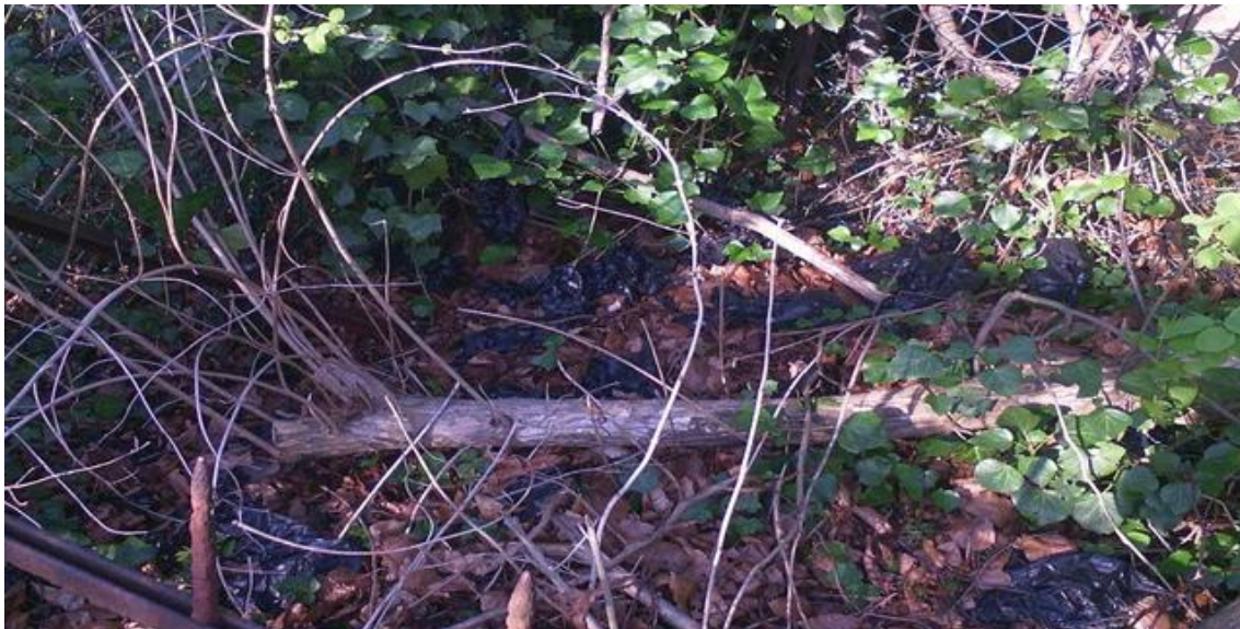
Abbildung 1: Gefüllte Hundekotbeutel auf einem bewohnten Grundstück

Einkaufstüten stehen heute sehr stark im medialen Fokus. Bei Hundekotbeuteln ist dies noch nicht der Fall. Im Gegensatz zu Einkaufstüten werden Hundekotbeutel verstärkt im naturnahen Bereich eingesetzt und landen somit vielerorts viel häufiger als Einkaufstüten in den Grünanlagen oder im Gewässer, obwohl sie nur etwa 4 % der Plastiktütenmenge ausmachen. Verstärkt wird dieser Effekt durch einen hohen Anteil mutwillig entsorgter Hundekotbeutel, überwiegend in gefülltem Zustand. Anders als bei anderen Müllarten scheint es bei Hundekotbeuteln noch ein fehlendes Problembewusstsein zu geben - derartig gehäufte mutwillige Umwelteinträge sind sonst vermutlich nur noch bei Zigarettenstummeln, Kaugummis oder Schnapsflaschen zu beobachten. Unter Umweltaspekten nicht so relevant, aber symbolisch für das fehlende Problembewusstsein ist die Entsorgung auf Grundstücken von Anwohnern: