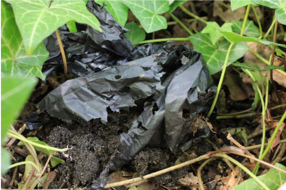
Abbildung 5: Biologisch abbaubarer Hundekotbeutel der Folag AG im Abbauprozess in der Hamburger Natur