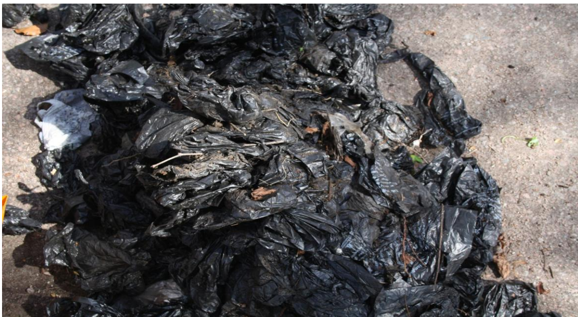
Abbildung 3: Gesammelte Hundekotbeutel bei Aufräumaktion am Leinpfad in Hamburg

Zudem lassen sich über die Detailansicht der Poop Bag Map Problembereiche identifizieren, die zur Mülleimerstandortoptimierung genutzt werden können.